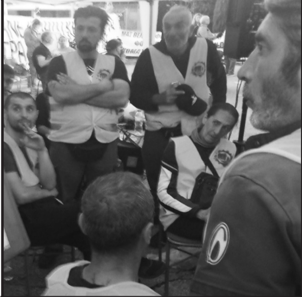
Συνελεύσεις κατά την διάρκεια της απεργιακής περιφρούρησης για να συζητήσουμε την συνέχεια της περιφρούρησης, και πως θα σταθούμε απέναντι στην έντονη και απειλιτική παρουσία της αστυνομίας. Η ομόφωνη απόφαση μας ήταν : ΟΥΤΕ ΒΗΜΑ ΠΙΣΩ.