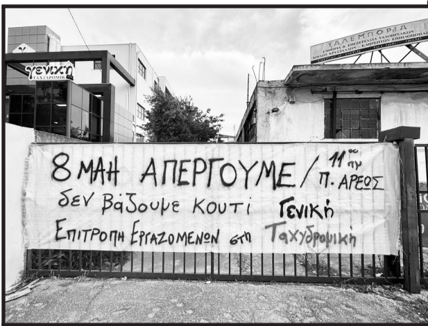
Πανό από την «Επιτροπή Εργαζομένων στη γενική ταχυδρομική», που προπαγάνδισε την απεργία με πανό και μοιράσματα κειμένων σε καταστήματα της εταιρείας.