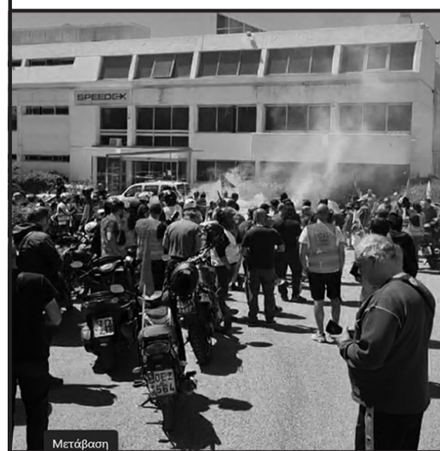
Η απεργιακή μοτοπορεία από το π. Άρεως φτάνει αιφνιδιαστικά στην Σπήντεξ ΑΕ στην Κηφισιά. Η θερμή υποδοχή από τους απεργούς εργαζόμενους, η αλληλεγγύη και η συναδελφικότητα, δίνουν στον αγώνα νέα προοπτική

σύστημα Εργάνη, ενώ στο τέλος του μηνύματος τόνιζε: «Ο σκοπός της παρουσίας σας είναι η διασφάλιση των επιχειρηματικών σας συμφερόντων». Συνολικά, το σωματείο κατέθεσε 3 καταγγελίες στην Επιθεώρηση Εργασίας για να προβεί σε έλεγχο στο hub. Όμως, μόνο μετά από παρέμβαση στο Υπουργείο Εργασίας εμφανίστηκε κλιμάκιο για έλεγχο στις 7 Μαΐου και ώρα 19:00, ενώ το σωματείο είχε ζητήσει έλεγχο μετά