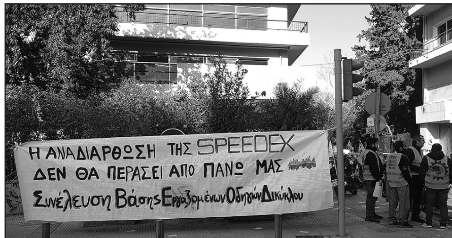
Τετάρτη 20 Νοέμβρη: Απεργιακή περιφρούρηση στην speedex Βοτανικού μαζί με το επιχειρησιακό σωματείο της εταιρείας