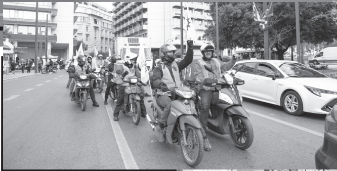
Φωτογραφίες από τις 9 Μάρτη 2024