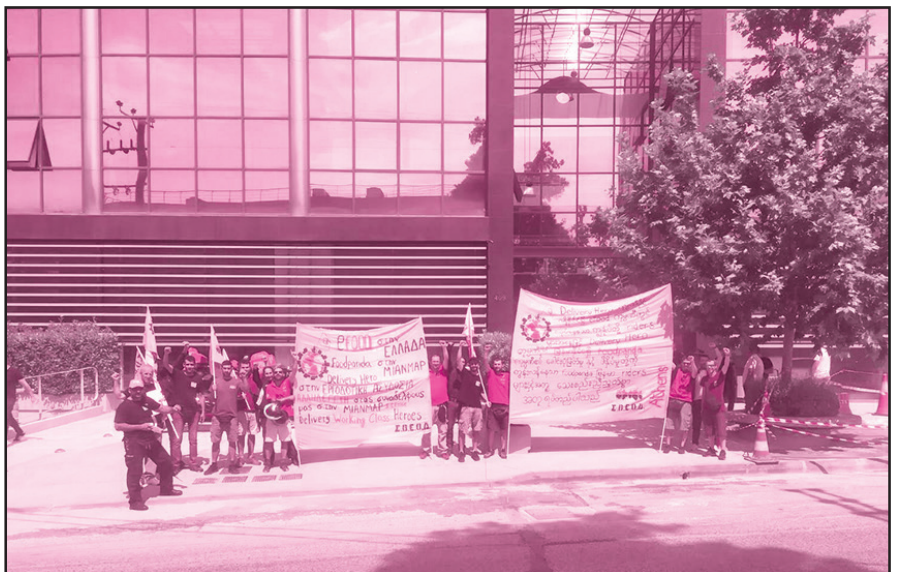
Ιούνιος 2022: Παρέμβαση της επιτροπής efood και του ΣΒΕΟΔ στα γραφεία της efood στην Λ. Ηρακλείου 409, σε ένδειξη αλληλεγγύης στους συναδέλφους από την Μίαν Μαρ, που αγωνίζονται για καλύτερες συνθήκες εργασίας σε ένα κράτος όπου υπάρχει χούντα.

Το δίκτυο Delivery Hero Riders United είναι ένας ζωντανός οργανισμός που δεν θα μπορούσαμε να μην είμαστε τμήμα του. Οι συναντήσεις γίνονται διαδικτυακά σε μηνιαία βάση και εμείς είμαστε παρόντες ενισχύοντας το με τις τοποθετήσεις, τις θέσεις και τις προτάσεις μας. Στην παρούσα φάση γίνονται ζυμώσεις και χαράσσουμε στρατηγική με τελικό στόχο την δημιουργία ενός παγκόσμιου συνδικάτου Delivery Hero, φτιαγμένο από διανομείς, που αγωνίζεται για τα δικαιώματα όλων όσοι εργάζονται στην Delivery Hero και θα αποτελέσει παράδειγμα για τους εργαζομένους σε κάθε πολυεθνική εταιρεία.