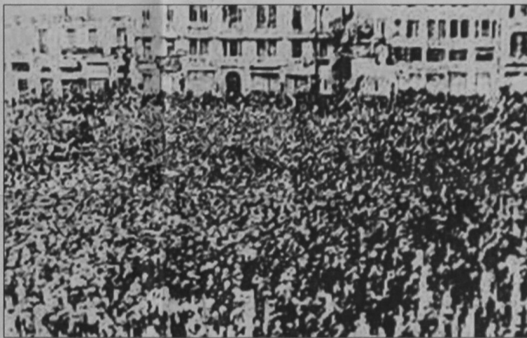
Από συγκέντρωση εργατικής πρωτομαγιάς στην Αθήνα