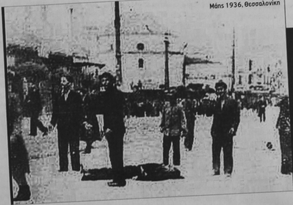
Μάης 1936, Θεσσαλονίκη

ΣΥΝΕΛΕΥΣΗ ΒΑΣΗΣ ΕΡΓΑΖΟΜΕΝΩΝ ΟΔΗΓΩΝ ΔΙΚΥΚΛΟΥ