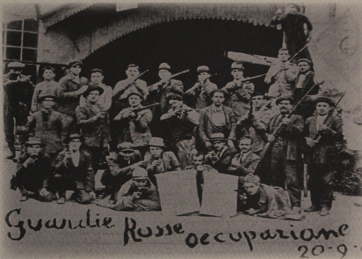
Ένοπλα εργατικά συμβούλια, Ιταλία 1920