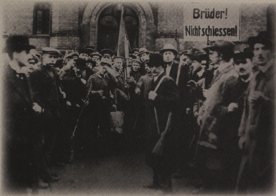
Η επανάσταση των σπαρτακιστών 1918