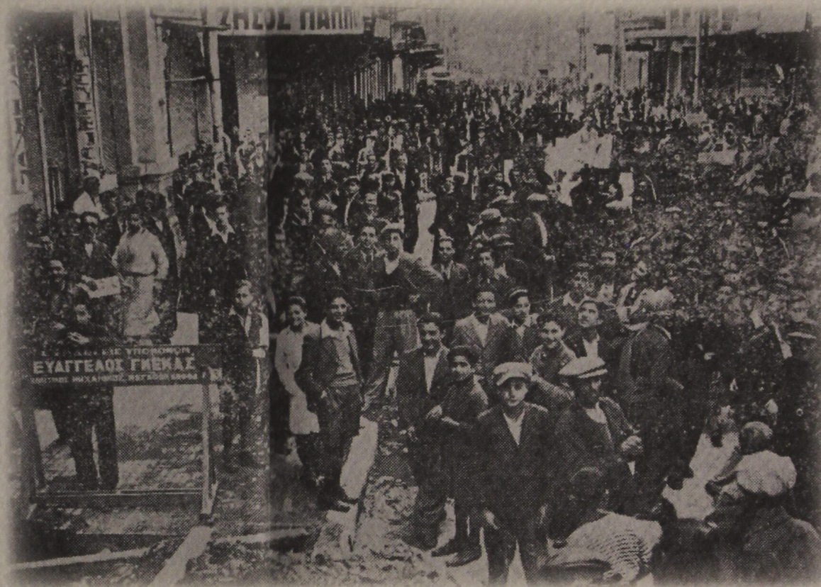
Η εξέγερση της Θεσσαλονίκης 1936