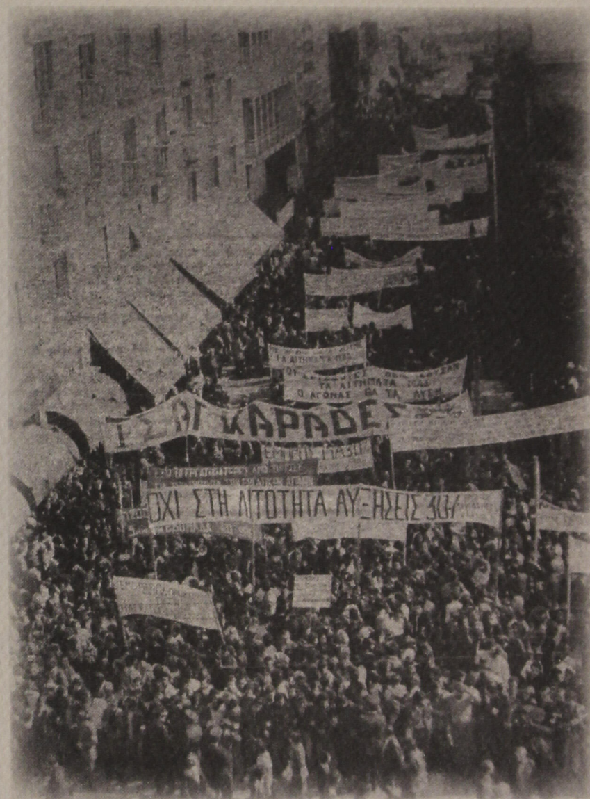
Ταξικοί αγώνες στη μεταπολίτευση