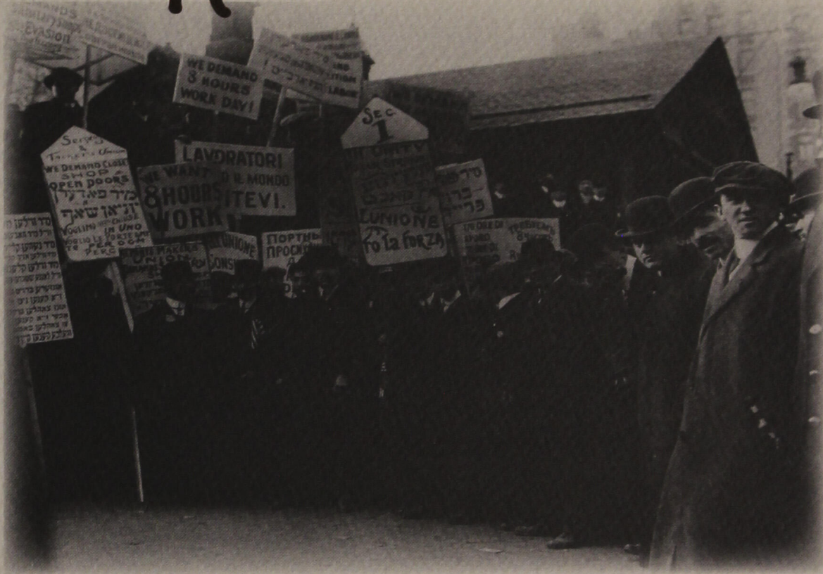
IWW Βιομηχανικοί εργάτες του κόσμου 1905