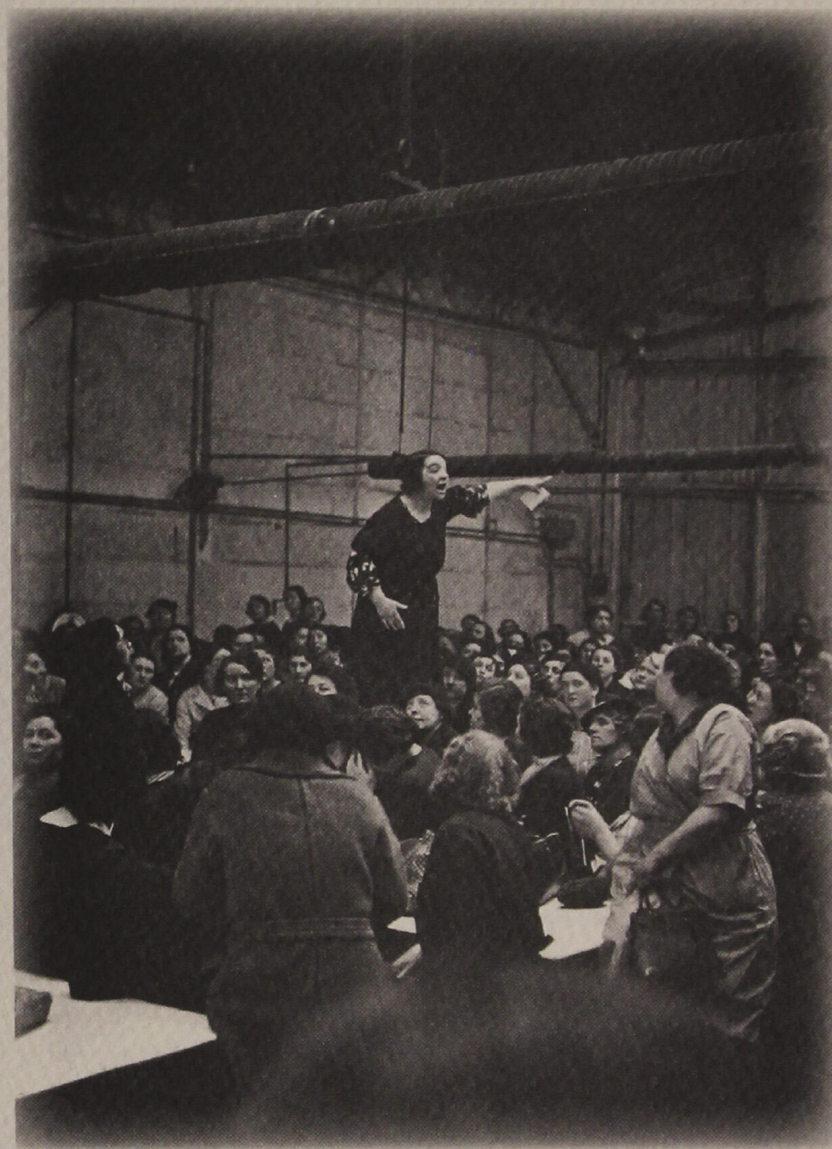
Το λαϊκό μέτωπο στη Γαλλία 1936-1938