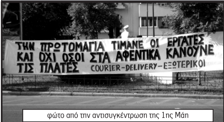
φώτο από την αντισυγκέντρωση της 1ης Μάν