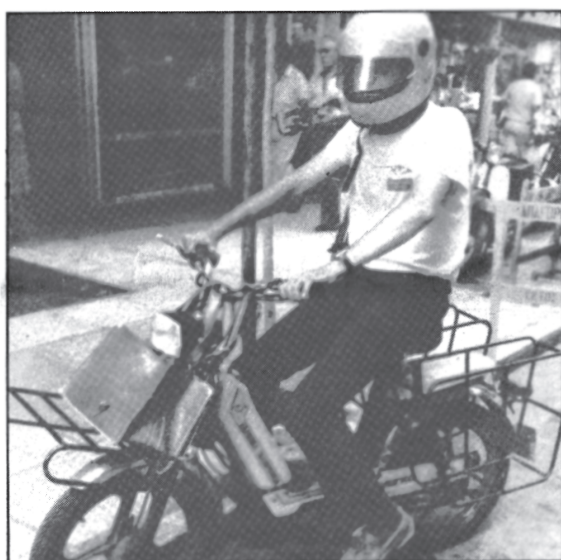
Το νέο σύστημα διανομής θα βασίζεται σε μεγάλο μέρος στους υπηνακίνητους διανομείς.

Όπως δήλωσε ο κ. Βουρνάς, η «Πόρτα-Πόρτα» θα στηριχθεί σε άρτια ενημερωμένο ειδικό προσωπικό (70 άτομα) και στο νέο τεχνικό εξοπλισμό που προμηθεύεται ο οργανισμός και αποτελείται από 21 αυτοκίνητα διάφορων κατηγοριών, 60 δίκυκλα μηχανοκίνητα με εξοπλισμό ασύρματης επικοινωνίας, 2 σταθμούς βάσης και τρεις αναμεταδότες.