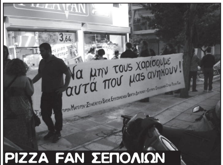
PIZZA FAN ΣΕΠΟΛΙΩΝ