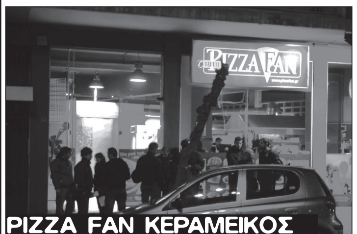
PIZZA FAN ΚΕΡΑΜΕΙΚΟΣ