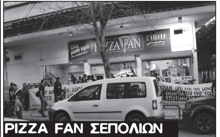
PIZZA FAN ΣΕΠΟΛΙΩΝ

Σωματείο Σερβιτόρων Μαγείρων & λοιπών εργαζομένων του κλάδου του επισιτισμού (Σ.Σ.Μ)