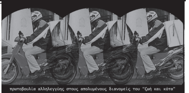
πρωτοβουλία αλληλεγγύης στους απολυμένους διανομείς του "ζωή και κότα"