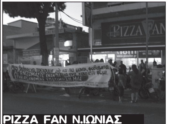
PIZZA FAN Ν.ΙΩΝΙΑΣ