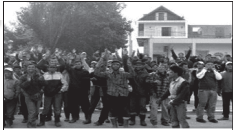
Μανωλάδα, Απριλίου 2008: οι μετανάστες εργάτες στο δρόμο της Απεργίας, στο δρόμο του Αγώνα!

Η Μανωλάδα βρίσκεται παντού. Στην Αμυγδαλέζα και τα υπόλοιπα στρατόπεδα συγκέντρωσης που εκατοντάδες μετανάστες κρατούμενοι απαντούν στον εγκλεισμό και τα βασανιστήρια των ανθρωποφυλάκων με μαζική απεργία πείνας απαιτώντας ζωή και λευτεριά. Στα αστυνομικά τμήματα και τα σύνορα, αυτούς τους τόπους βασανιστηρίων και θανάτου για χιλιάδες προλεταίριους. Στους δρόμους και τις πλατείες της Μητρόπολης, εκεί που τα νεοναζι θρασυδελία θρεφτάρια κυνηγούν, μαχαιρώνουν και δολοφονούν τα παρανομοποιημένα κομμάτια της Τάξης μας. Στα εργασιακά κότερα της υπερεντατικοποιημένης εκμετάλλευσης που οι σύγχρονοι πληβείοι φτύνουν αίμα για ένα κομμάτι ψωμί, που όταν το διεκδικούν λαμβάνουν απειλές και βία. Το απάνθρωπο παρόν των μεταναστών εργατών είναι το μέλλον που έρχεται με βήμα ταχύ για το σύνολο της εργατικής Τάξης. Το παρόν και το μέλλον της υποτιμημένης, της μαύρης, της απλήρωτης εργασίας, της καταστολής των εργατικών αγώνων, της απαγόρευσης κάθε απεργίας, του ματοκυλισματος κάθε διαδήλωσης, της σιδερόφρακτης αστικής δημο-