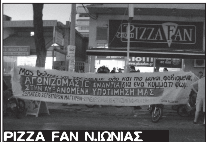
PIZZA FAN Ν.ΙΩΝΙΑΣ