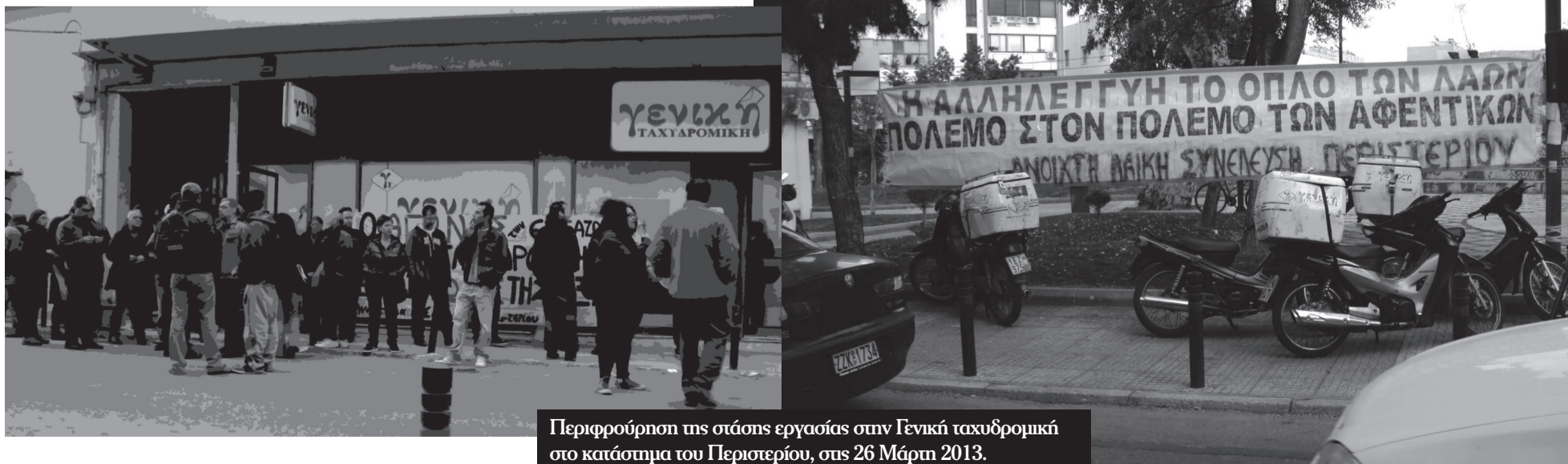
Περιφρούρηση της στάσης εργασίας στην Γενική ταχυδρομική στο κατάστημα του Περιστερίου, στις 26 Μάρτη 2013.