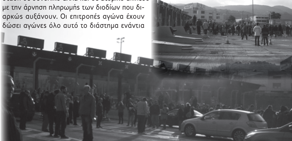
Από δράση στα διόδια της Μαλακάσας

60 ΑΠΟΛΥΣΕΙΣ ΓΙΑ ΤΗΝ ΑΥΞΗΘΟΥΝ ΤΑ ΚΕΡΔΗ ΤΗΣ ΤΡΑΠΕΖΗΣ